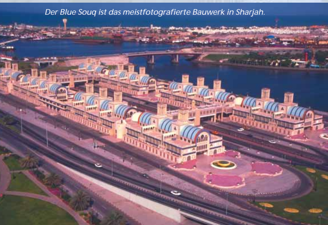
Der Blue Souq ist das meistfotografierte Bauwerk in Sharjah.