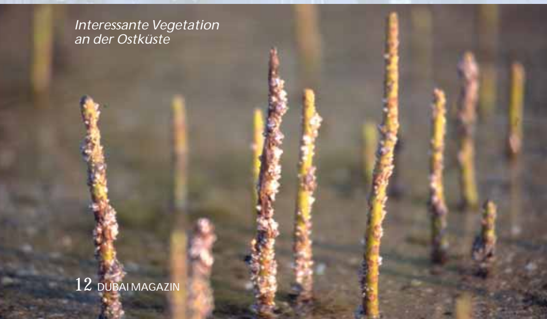
Interessante Vegetation an der Ostküste

blumengarten, Souvenir-Shops und Cafeterias begeistern vor allem die lebendigen Tiere. Selbst die großen Wüstenbewohner wie Leoparden, Geparden, Hyänen, Wölfe oder Paviane bewegen sich in Freigehegen, Zäune sind nicht zu sehen. Der Besuch des Desert Parks ist absolut lohnend, denn auch aus dieser Sicht präsentiert sich Sharjah unter den VAE einzigartig.