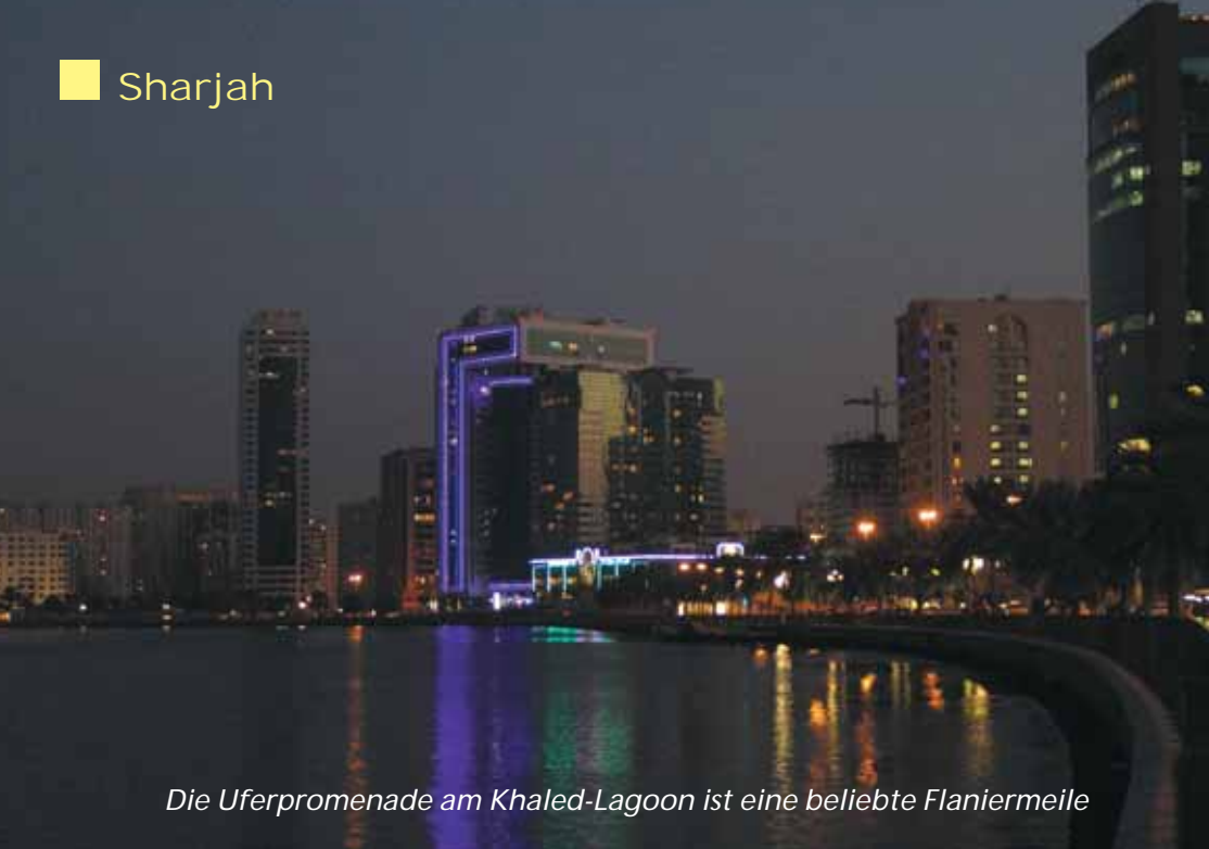
Die Uferpromenade am Khaled-Lagoon ist eine beliebte Flaniermeile