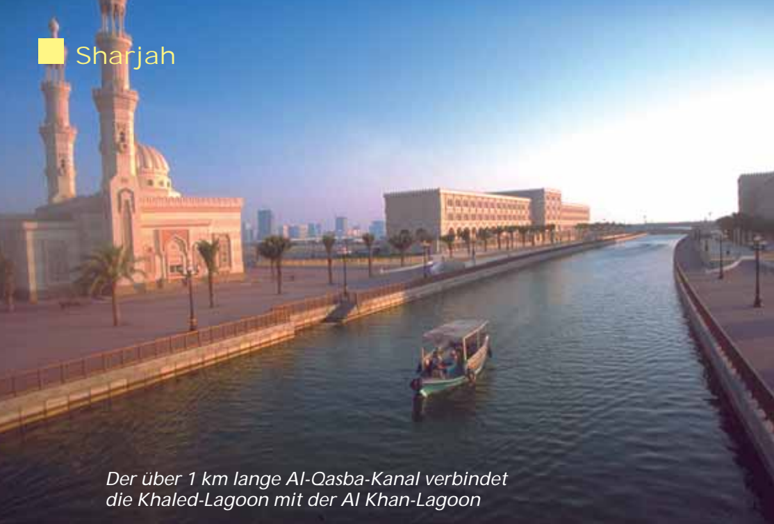
Der über 1 km lange Al-Oasba-Kanal verbindet die Khaled-Lagoon mit der Al Khan-Lagoon