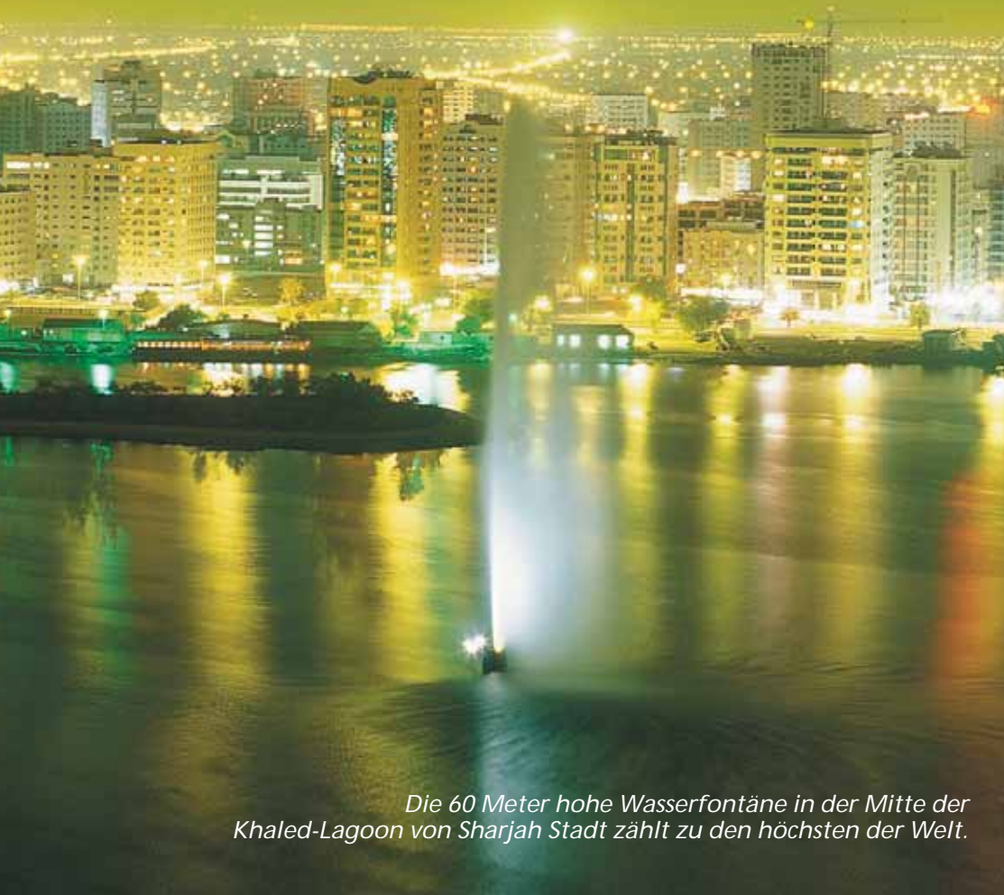
Die 60 Meter hohe Wasserfontäne in der Mitte der Khaled-Lagoon von Sharjah Stadt zählt zu den höchsten der Welt.

Die Vereinigten Arabischen Emirate sind bekanntlich ein Zusammenschluss von insgesamt sieben Emiraten: Abu Dhabi, Dubai, Sharjah, Fujairah, Ras Al Khaimah, Ajman und Umm Al Quwain. Sie erstrecken sich an der südöstlichen Küste des Arabischen Golfs entlang, sind begrenzt von den Staaten Oman im Osten, Saudi-Arabien im Südwesten und Qatar im Westen. Die größten Städte sind Abu Dhabi, Dubai und Sharjah, das nur 10 km nordöstlich von Dubai-City liegt. 80% der Einwohner der VAE sind Ausländer und vor allem in Abu Dhabi, Dubai und Sharjah bilden die ausländischen Arbeitskräfte die Bevölkerungsmehrheit; in den restlichen vier Emiraten beherrscht immer noch die einheimische Bevölkerung das Straßenbild. Bereits Ende der 70er Jahre des vergangenen Jahrhunderts wagte Sharjah als erstes Emirat den Vorstoß, sich dem Tourismus aus westlichen Ländern zu öffnen. Seitdem hat sich eine enorme Entwicklung vollzogen, heute vereinigt sich hier mühelos und harmonisch die moderne Infrastruktur mit den traditionellen Werten des Islam und macht Sharjah zu einer begeisternden Destination mit einer einzigartigen Kultur, nationalem Stolz und äußerst reizvollen Kontrasten.