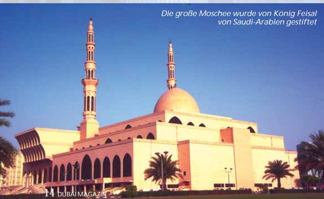
Die große Moschee wurde von König Feisal von Saudi-Arabien gestiftet

Arabien und den Golf von Oman im Indischen Ozean – kann das Emirat ganz besondere touristische Register ziehen. Es verfügt über Wüstengebiete, Sumpfbereiche, Sandstrände, Berge, Wadis (Wadi = ausgetrocknetes Flussbett), subtropische Gärten und Tauchparadiese! In Sharjah herrscht Wüstenklima, doch das Meer, das den Großteil des Emirats säumt, lässt die Luftfeuchtigkeit im Hochsommer zuweilen bis auf 100% hochklettern – eine schweißtreibende Angelegenheit! Als ideale Reisezeit sind deshalb die Monate November bis April zu empfehlen, mit moderaten Temperaturen bis 30°C, sowie relativ trockener Luft. In dieser Jahreszeit kann es theoretisch zwar auch einmal regnen – aber bei einer Niederschlagsmenge von 13cm jährlich ist dies relativ unwahrscheinlich. Außerdem zeigt sich nach einem erfrischenden Guss, anders als in Deutschland, meist schnell wieder die Sonne.